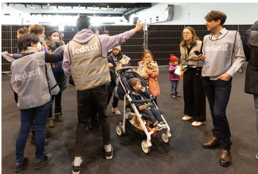
Oekraïense vluchtelingen aangekomen in België